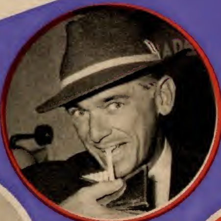
Alfred Steele, der jetzige (für Philipp Terry, den 3. Ehemann, war nur in Joans Leben, aber nicht mehr auf unserer Seite Platz).